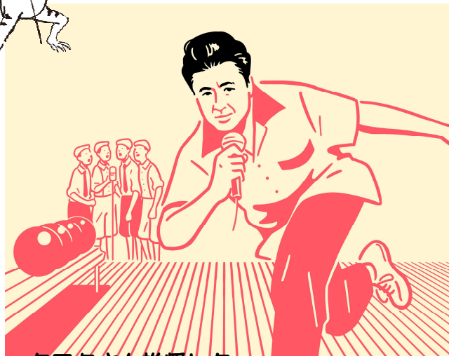
クワタさん推奨レク